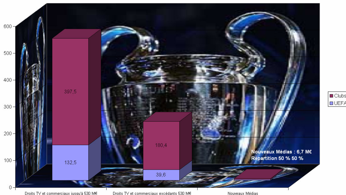
Répartitions des droits commerciaux et nouveaux médias - Ligue des champions 2006/07

La répartition des contrats commerciaux :