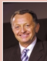
▲ Jean-Michel AULAS (Olympique Lyonnais)